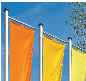
Return Funktion bei Windstille