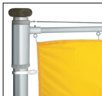
Rückstellfeder im oberen Bereich